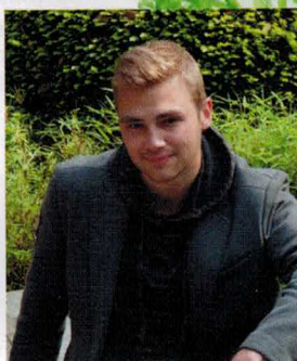
PAR FLORIAN DEMON